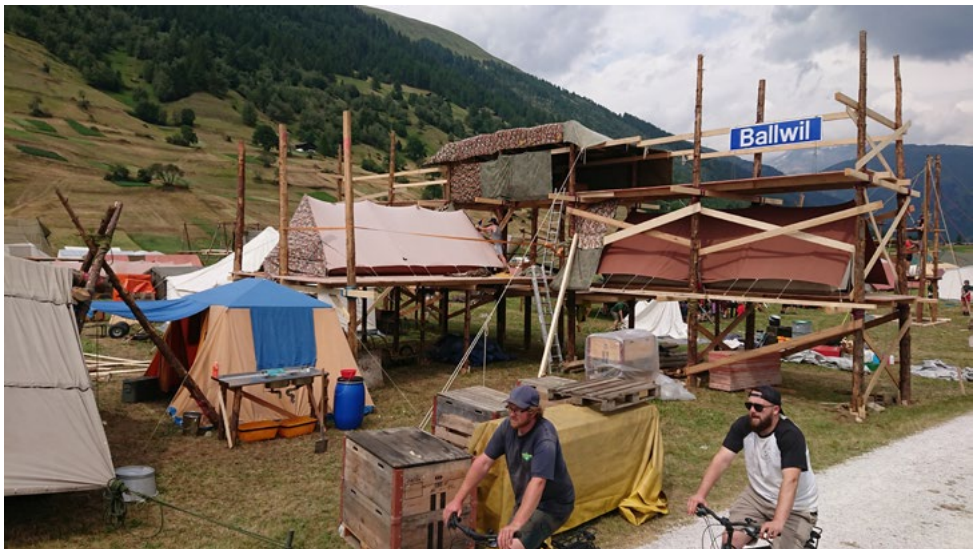
Aufbau im Bundeslager 22; links blau-beiges Vorratszelt