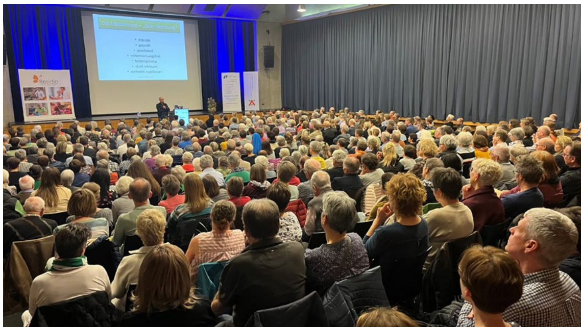
Der Brauisaal Hochdorf war bis auf den letzten Platz gefüllt.