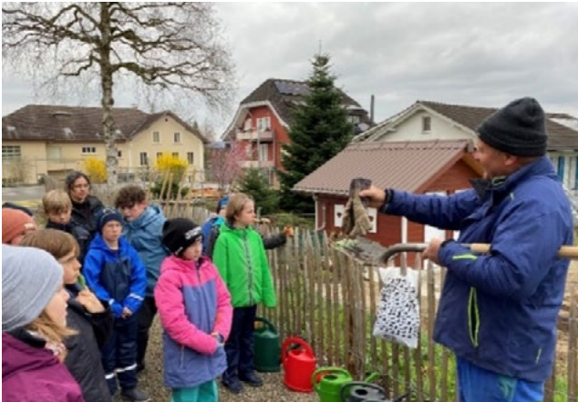
Mit vollem Einsatz an der Arbeit.