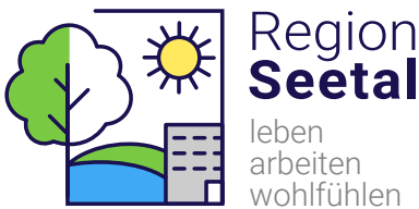
Das Label zum Regionalmarketing