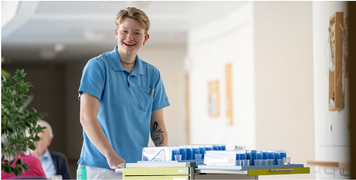
Die Mitarbeitenden sind die Seele des BZ Dösselen.

sehr erfüllend. Die täglichen kleinen Zeichen des Dankes, ein spannender Einblick in ein langes, gelebtes Leben und das Bewusstsein, Menschen auf ihrem letzten Wegstück würdevoll und achtsam begleiten zu dürfen, bereichern das eigene Leben.